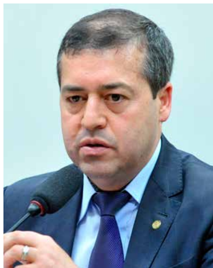
Ministro Ronaldo Nogueira

Na contramão do medo do trabalhador que quer ver o país crescer, o ufanismo do ministro Ronaldo Nogueira encontra eco em alguns setores da economia, mais especificamente da iniciativa privada. Para diversos empresários, a legislação anterior judicializava demais as relações trabalhistas, deixando o empregador com receio e restrições ao contratar, diante das 4 milhões de ações trabalhistas que anualmente chegam nas mãos dos juízes. Segundo pesquisa da Fiesp, 77% dos empresários acham que