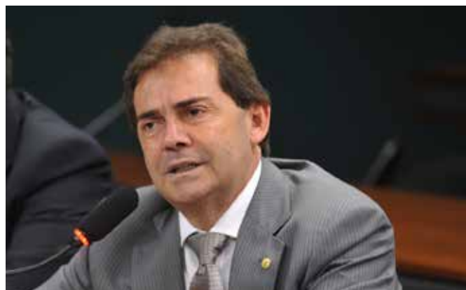
* Paulo Pereira da Silva – Paulinho é presidente da Força Sindical e deputado federal (SD-SP)

Sabemos que nossa luta é árdua, pois enfrentamos forças poderosíssimas que têm outros interesses que não os nossos. Por isso, para que alcancemos nossos objetivos de “passar o País a limpo”, trazendo dignidade, igualdade de oportunidades e justiça social a toda a sociedade brasileira, todos nós temos de dar as mãos e, imbuídos de um mesmo ideal, defendermos a causa dos trabalhadores brasileiros, porque o que está em jogo é o nosso futuro, o futuro dos nossos filhos e netos e do próprio Brasil.